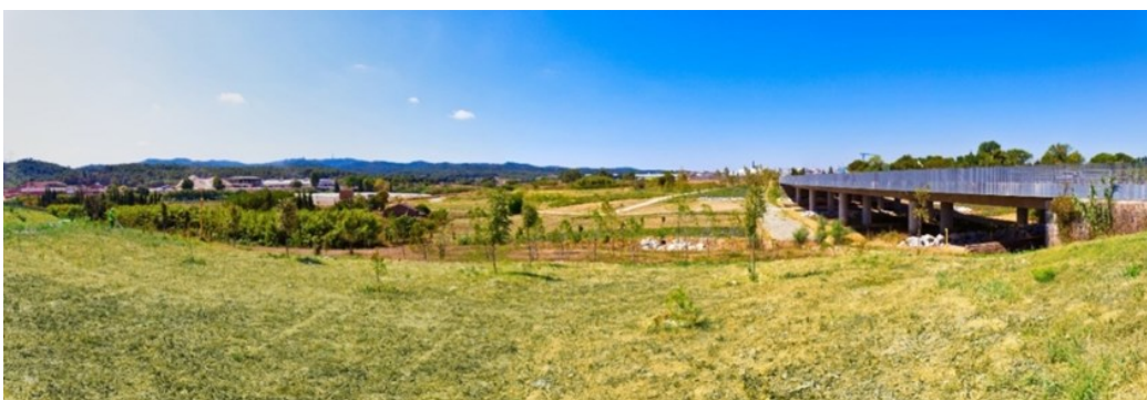
Carretera BP-1413 Sant Cugat-Cerdanyola reconstruïda pel Parc, amb els seus viaductes (a la dreta) que permeten el pas de la fauna i la configuració del corredor biològic

Des del primer disseny del parc, el plantejament de l'espai va definir un conjunt harmoniós de sectors on les àrees empresarials i residencials conviuen amb les destinades als cultius, torrents i boscos, i on es conserva un extens connector biològic en el qual s'està treballant per tal de millorar la permeabilitat de la fauna.