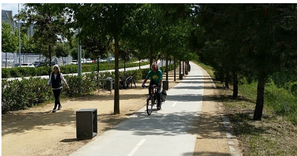
Carril bici del Parc de l'Alba – BSP

Les 8.000 hectàrees del parc natural de Collserola , el pulmó verd de Barcelona, a les quals es pot accedir directament i immediatament des del Parc de l'Alba – BSP ofereixen una oportunitat addicional per als residents de la zona.