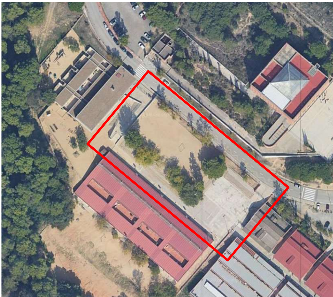
Vista aèria zona actuació