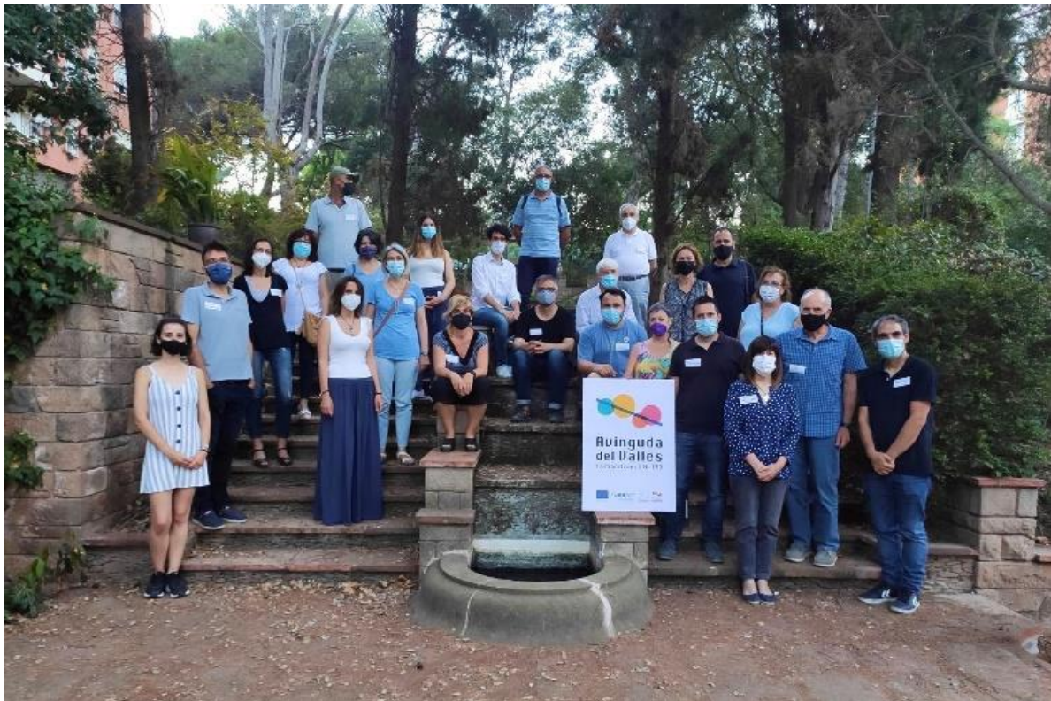
Grup de cocreació a la cinquena sessió, el 15 de juny als Jardins de Ca n'Ortadó de Cerdanyola

Tots els que hem participat al llarg d'aquests mesos en aquest procés de cocreació ens congratulem per totes les aportacions i opinions, i pel temps i l'energia que hi hem dedicat. Alhora, ens animem a continuar treballant a partir del setembre per humanitzar l'N-150 i convertir-la en l'Avinguda del Vallès.