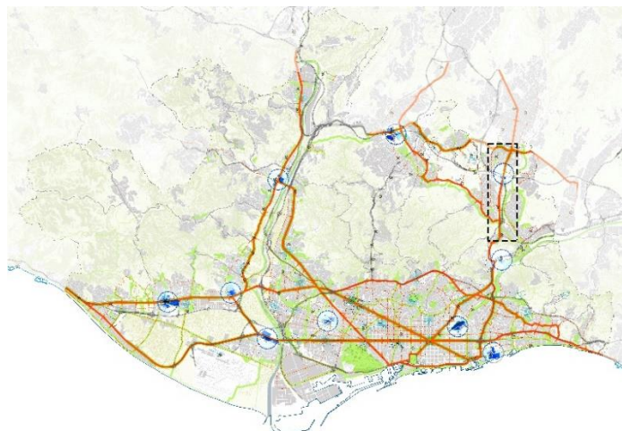
Tram objecte d'estudi de l'avinguda metropolitana que va del Fòrum a Sabadell

Per desenvolupar el seu PAI, l'AMB va triar l'àmbit de l'N-150, un tram d'una futura avinguda metropolitana que ha de connectar Sabadell amb el port del Fòrum a Barcelona.